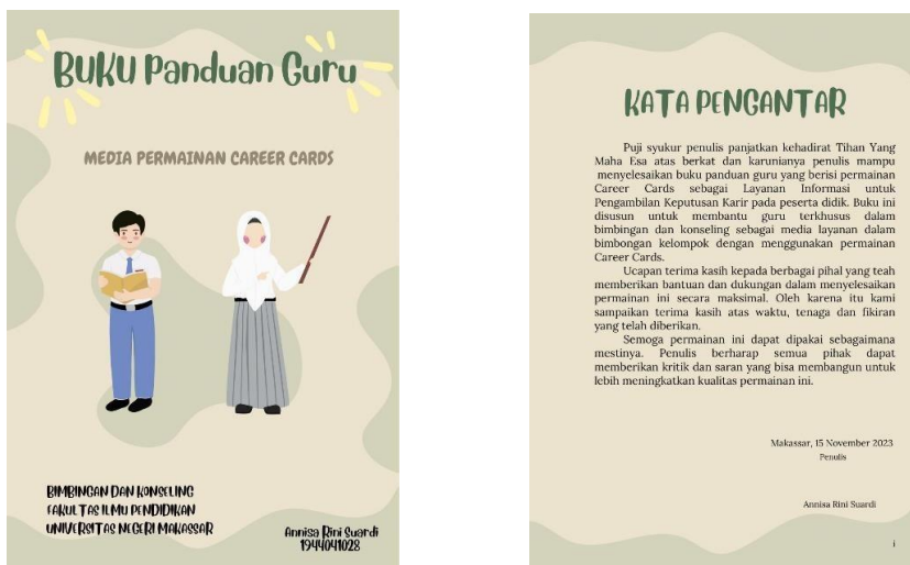
Gambar 4. Perancangan desain buku panduan penggunaan permainan