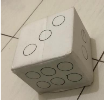
Gambar 3. Perancangan desain dadu terbuat dari kardus