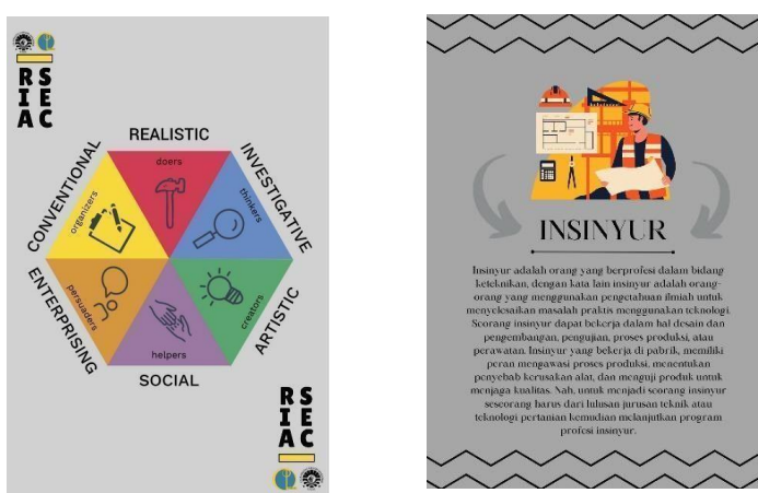
Gambar 1. Perancangan desain tampilan card (depan dan belakang)

Terdapat gambar dalam card yang digunakan pada media tersebut, perancangan dilakukan menggunakan aplikasi Canva. Desain gambar semenarik mungkin. Pembuatan desain gambar menggunakan aplikasi canva dapat dilihat pada gambar