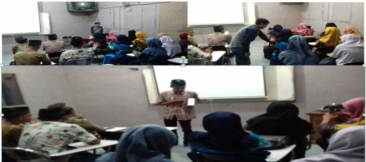
Gambar 2: Kegiatan Pelatihan dan Pendampingan Pemanfaatan aplikasi Duolingo

memberikan penilaian terhadap kemampuan masing-masing peserta dalam menggunakan aplikasi Duolingo . Selain itu, Tim pengabdian masyarakat juga memberikan pendampingan lebih lanjut pada peserta melalui media komunikasi whatsapp atau e-mail . Hal ini dilakukan untuk memantapkan bahwa para peserta pelatihan benar-benar mampu menggunakan aplikasi Duolingo dengan baik dan benar.