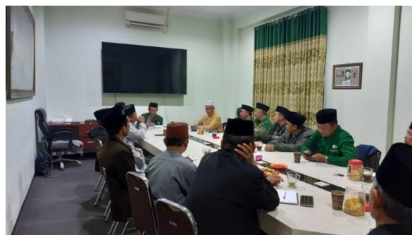
Gambar 2. Tahap Pelaksanaan – Pengembangan Content

Pada tahap pelaksanaan, diawali dengan mendiskusikan content yang akan dimuat dalam berbagai media. Potensi isu yang disepakati pada tahap ini terkait dengan toleransi dan moderasi beragama, dan fikih kebangsaan yang merujuk pada sumber-sumber yang telah secara tradisi dirujuk oleh lingkungan pesantren, seperti turats , hadist , dan kitab-kitab islami.