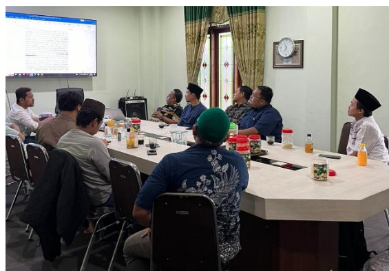
Gambar 3. Workshop penyusunan draf

Pada tahap pelaksanaan, diawali dengan mendiskusikan content yang akan dimuat dalam berbagai media. Potensi isu yang disepakati pada tahap ini terkait dengan toleransi dan moderasi beragama, dan fikih kebangsaan yang merujuk pada sumber-sumber yang telah secara tradisi dirujuk oleh lingkungan pesantren, seperti turats , hadist , dan kitab-kitab islami.