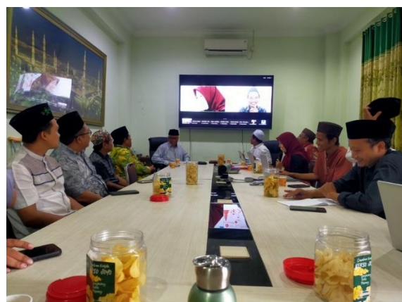
Gambar 8. Peluncuran content digital dan Buku Komik Fikih Kebangsaan, sekaligus Evaluasi bersama Mitra

Berdasarkan hasil evaluasi yang dilakukan, disepakati bahwa produk content creator yang dibuat dalam bentuk digital kemudian juga dicetak. Hal ini diputuskan dengan pertimbangan ketersediaan jaringan internet yang belum merata dan akses digital yang belum dimiliki oleh pesantren-pesantren di daerah. Dengan dicetaknya komik digital ini, akan meningkatkan aksesibilitas pada informasi dakwah yang dimuat dalam kemasan yang lebih populer dan baru. LAKPESDAM NU Kota Malang, sebagai mitra, menganggap kegiatan ini menjadi pintu syiar agama yang lebih tepat sasaran. Media yang tidak monoton akan menarik jangkauan yang lebih luas, dengan tidak meninggalkan prinsip agama sebagai petunjuk hidup bersosial masyarakat. Di sisi lain, para peserta (santri) pelatihan pembuatan content komik digital merasa terbantu dengan adanya inspirasi pilihan media yang baru yang turut meningkatkan skill dan potensi artistik mereka. Ketertarikan ditunjukkan dengan semangat dan kesediaan mereka untuk menindaklanjuti kegiatan serupa setelah buku komik ini diluncurkan.