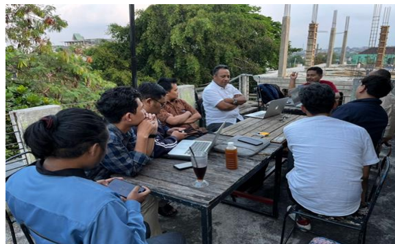
Gambar 1. Tahap Persiapan - Diskusi tentang Pemetaan Modal dan Mitra Content Creator

berbagai kajian untuk memperkaya materi dakwah seperti isu moderasi beragama, toleransi, fikih kebangsaan, namun penyebarluasannya belum maksimal.