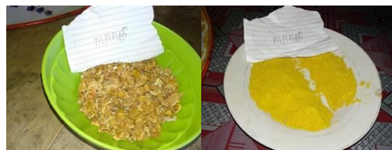
Gambar 3: Bentuk produk padat kering menjadi bubuk

Selanjutnya terkait kemasan, hasil observasi menunjukkan bahwa kemasan yang digunakan awalnya sangat tidak memenuhi standar produk, baik kualitas, kesehatan maupun standar keamanan kemasan. Untuk itu pada kegiatan pendampingan tahap II produk yang awalnya cair kemudian di transformasi menjadi bentuk bubuk. Proses pembuatan produk menjadi bubuk, dengan mendampingi dan mengarahkan mitra agar bahan baku yang semula basah kemudian dikeringkan, kemudian dihaluskan dengan alat penghalus bumbu. Bahan baku produk dari padat menjadi bubuk sebagaimana ditunjukkan pada gambar berikut.