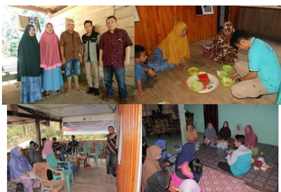
Gambar 2: Koordinasi dan pendampingan awal

Hasil kegiatan awal setelah dilakukan pendampingan melalui diskusi kelompok bersama mitra disepakati hasil evaluasi kemasan produk, merek, dan label produk. Setelah dilakukan diskusi dan analisa maka dibuatlah merek dagang dengan nama “Marasa Kunyit”. Kegiatan awal pertemuan dan pendampingan mitra sebagaimana ditunjukkan pada Gambar berikut.