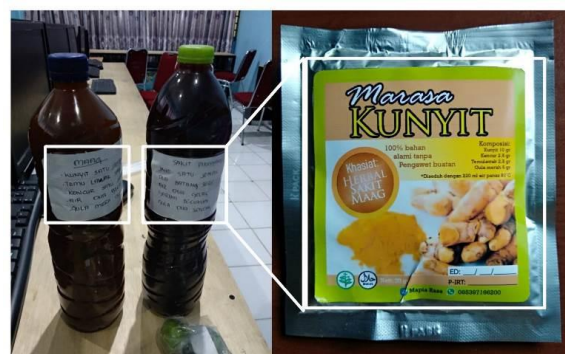
a. Pengemasan Sebelum program PKM

Produk yang telah berbentuk bubuk selanjutnya dikemas menggunakan kemasan produk bubuk berbentuk persegi empat ukuran 10x10 Cm berbahan Aluminium Foil yang tentunya lebih tahan dan aman lengkap dengan desain label kemasan yang menarik. Perbandingan kemasan dan label produk sebelum dan setelah pendampingan dilakukan sebagaimana ditunjukkan pada gambar berikut.