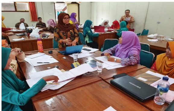
Gambar 3. Praktik Peer Counseling tersupervisi/ Supervised Peer Practicum

Pelaksanaan pelatihan menggunakan metode peer counseling/peer teaching tersupervisi sebagaimana dapat dilihat pada gambar 3. Melalui pendekatan ini, peserta pelatihan dapat mencapai penguasaan konsep dan keterampilan dalam menelaah dan mengkaji lebih lanjut strategi sinema-konseling. Hal ini sesuai dengan hasil penelitian yang dilakukan oleh Muslikah, Hariyadi, dan Amin (2016) yang membuktikan bahwa konsep peer terbukti efektif dalam rangka pembelajaran konseling dan meningkatkan kemampuan peserta latih dalam pengembangan kompetensi konseling yang dimiliki. Selain itu, Falchchiko & Goldfinch (2000) menyatakan bahwa metode peer memiliki hasil yang cukup efektif bahkan tidak jauh berbeda dengan penilaian yang dilakukan oleh pengajar. Senada dengan dua penelitian di atas, Antika (2017) dalam penelitiannya membuktikan bahwa strategi peer supervision dapat meningkatkan tujuan pembelajaran.