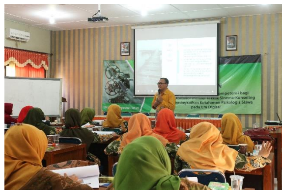
Gambar 2. Kegiatan Ekspositori, Tanya Jawab, dan Diskusi

Pada sesi ekspositori dan diskusi, peserta nampak antusias karena beberapa peserta mengaku baru pertama kali mengenal sinema-konseling. Meskipun hampir seluruh konselor/guru BK yang menjadi peserta pelatihan telah melaksanakan layanan konseling, strategi yang diaplikasikan selama ini masih bersifat konvensional. Sementara itu, di lain sisi perkembangan zaman mengharuskan konselor/guru BK untuk terus berinovasi dan mengembangkan kreativitas mereka dalam memberikan layanan yang efektif dan efisien sesuai dengan kebutuhan siswa. Pelaksanaan sesi ekspositori dan diskusi didokumentasikan pada gambar 2.