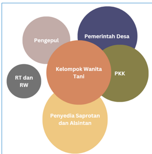
Gambar 3. Diagram Venn KWT Mekar Tani

Kesejahteraan keluarga petani tidak hanya bergantung pada maksimalnya fungsi yang dijalankan oleh KWT saja. Namun, kelembagaan-kelembagaan yang lain juga dapat menentukan keberhasilan dari tujuan terbentuknya KWT. Keterhubungan antar kelembagaan-kelembagaan tersebut dapat dilihat pada Gambar 2 di bawah ini.