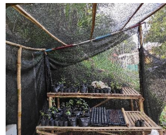
Gambar 1. Konfirmasi data pemetaan sosial, dengan Pokja 4 PKK yang membawahi KWT Mekar Tani dan Persemaian bibit sayuran