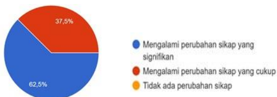
Diagram 2. Hasil Evaluasi Terkait Sikap

Sebagian besar peserta memperoleh tambahan pengetahuan setelah mengikuti kegiatan PKM ini (87,5 %). Hal itu terutama berhubungan dengan rekognisi produksi berita via media digital dan foto jurnalistik. Ada banyak hal baru dan relevan yang mereka peroleh melalui kegiatan pelatihan ini.