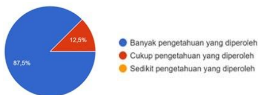
Diagram 1. Hasil Evaluasi Terkait Pengetahuan

Pelaksanaan kegiatan PKM diliput dan dipublikasikan oleh media lokal Pos Kupang. Com serta di- upload ke website kampus. Kegiatan PKM ditutup dengan penyerahan piagam penghargaan partisipasi kepada KJWSK, foto bersama, makan siang, dan diskusi rencana MoU dengan KJWSK. Kegiatan PKM ini juga mendapatkan hasil evaluasi yang positif dari para peserta. Penilaian dilakukan melalui isian link google form dibagikan kepada para peserta usai kegiatan berakhir. Evaluasi yang dimaksud berkaitan dengan aspek pengetahuan dan sikap, serta relevansi tema kegiatan.