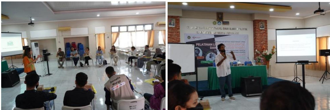
Gambar 1. Pemaparan Materi dan Praktik Pengolahan Foto Jurnalistik

Sesi berikut dilanjutkan dengan penyampaian materi terkait fotografi oleh narasumber kedua, seorang praktisi yang menggeluti bidang fotografi dan multimedia. Hampir semua produk berita yang dihasilkan oleh KJWSK selama ini bercorak tekstual. Teks berita menjadi aspek yang diutamakan di samping konten foto berita seadanya. Sisi fotografi berita turut memberikan kesan aktual pada isi teks berita. Keberadaan foto jurnalistik jauh lebih tua daripada jurnalistik tulisan. Aktivitas jurnalistik pertama kali dilakukan justru melalui visualisasi gambar. Foto jurnalistik memiliki keunggulan dalam hal timeless dan obyektivitas informasi yang diberitakan (Darmawan, 2005).