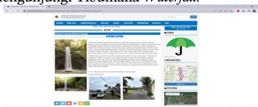
Gambar 4. Bukti dokumentasi dan publikasi konten destinasi wisata alam Desa Apuan.

Publikasi yang dilakukan pada tanggal 6 Februari 2023 konten berisi dokumentasi empat footage dari setiap sisi destinasi wisata yang menarik dan didampingi tulisan yang menjelaskan mengenai destinasi wisata alam yang ada di Desa Apuan, dilengkapi juga dengan tips saat mengunjungi destinasi ini sehingga memudahkan wisatawan untuk menyesuaikan barang bawaan ketika mengunjungi Tibumana Waterfall .