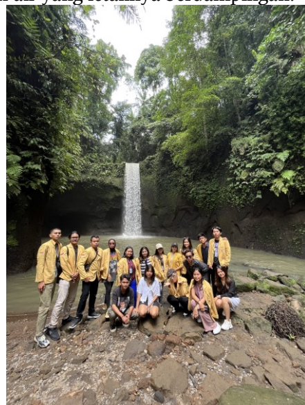
Gambar 2. Dokumentasi survei destinasi wisata alam Desa Apuan.

Kegiatan selanjutnya yaitu melakukan survei lapangan terkait destinasi wisata yang akan menjadi ikon dari Desa Apuan sehingga dapat menarik minat wisatawan untuk berkunjung ke desa ini. Destinasi wisata alam yang bernama Tibumana Waterfall yang mempunyai keunikan berupa bentuknya seperti air terjun kembar disebabkan oleh dua aliran air yang letaknya berdampingan.