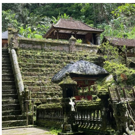
Gambar 3. Dokumentasi survei destinasi wisata spiritual Desa Apuan.