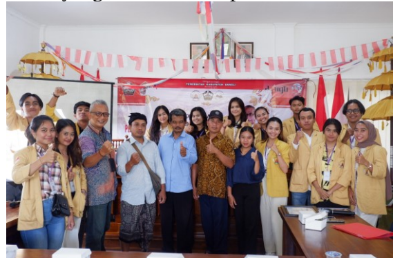
Gambar 1. Kegiatan koordinasi dengan Kepala Desa Apuan.

melakukan observasi diantaranya melakukan koordinasi dengan Kepala Desa Apuan yang bertempat di kantor desa membahas terkait dengan pemanfaatan website yang masih kurang dalam mempromosikan destinasi wisata yang ada di Desa Apuan.