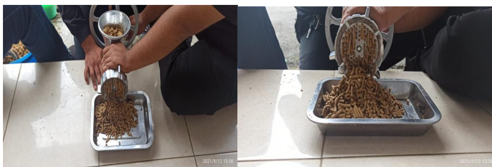
Gambar 2: Proses Pembuatan Pakan

Kegiatan pelatihan melibatkan kelompok juga akan melibatkan pelaku usaha dan masyarakat yang ada disekitar mitra atau tetangga desa/kelurahan. Pelatihan dilakukan setelah kegiatan pendampingan berjalan dan selesai dilakukan identifikasi permasalahan. Materi pada pelatihan ini mengacu pada upaya penyelesaian terhadap permasalahan yang ditemui kelompok. Selanjutnya kegiatan dilanjutkan dengan bimbingan teknis (Bimtek). Kegiatan bimtek ditekankan pada kegiatan pembuatan pakan mandiri. Pada kegiatan ini juga dilakukan percontohan mengenai teknik pembuatan pakan. Selain itu, peserta diberikan pembuatan pakan ikan dan perhitungan formulasi pakan. Pelatihan pembuatan pakan dapat dilihat pada Gambar 2.